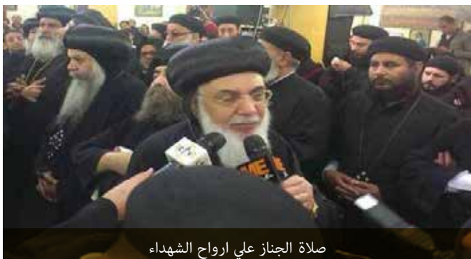
صلاة الجنائز علي ارواح الشهداء

كما أرسل غبطة البطريرك كيريل بطريرك موسكو وعموم روسيا، رسالة تعزية لقدااسة البابا الأنبا تواضروس الثاني في شهداء الإيمان والوطن.